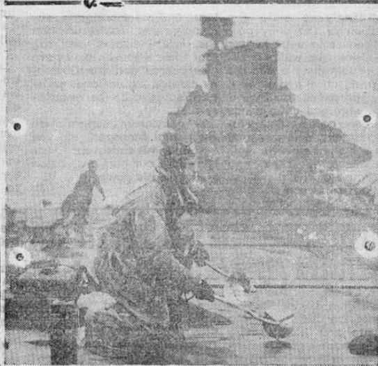
Después de haber sido reparado el portaviones "illustrious" vuelve al servicio.

Satisfaction, the desire of the masses, is to be had at Dixon's Barber Shop — West of the city Market.