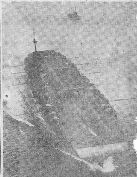
El portaviones "Illustrious" recomisionado y reparado listo para entrar en acción.

El Patronato Nacional de la Infancia, por medio de su Representante Legal, ha dirigido comunicaciones a todas las autoridades de policía y judiciales para que éstas comuniquen al Patronato las sentencias que recaigan sobre padres de menores o padres, cuando estos sean las únicas personas a cuyo cuidado hayan permanecido los hijos menores del hogar. En esta forma, el Patronato que evitar que las leyes dejen en el desamparo a los hijos menores de los padres que tengan que cumplir condena en los centros de reclusión. Varios han sido los casos en que las autoridades han debido condenar a prisión a los padres de menores, quienes han quedado en el más absoluto y lamentable desamparo. Ahora el Patronato velará por los hijos quienes deban ir a la cárcel e intentar alguna condena, recolectados y suministrándoles los cuidados que esos menores necesitan.